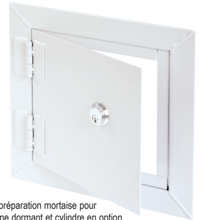
Photo avec préparation mortaise pour serrure à pêne dormant et cylindre en option.